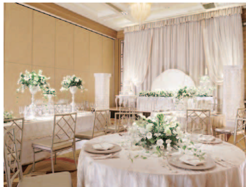
「Luxurious Wedding」/ 笹木 美保子 (Sasaki Mihoko)