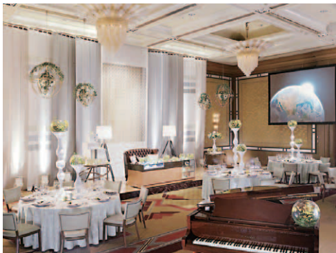
「Modernism Wedding Style」/ 下田 耕司 (Shimoda Koji)